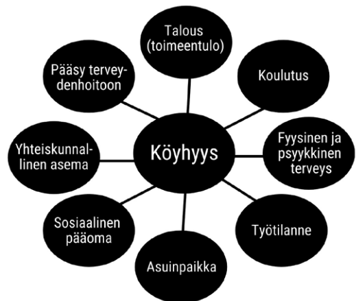
Kuva 2: Joitakin tekijöitä, jotka vaikuttavat eniten köyhyyteen. Köyhyeden arvioinnissa on otettava huomioon, ovatko kuvassa esitetyt osa-alueet henkilön ulottumattomissa osin tai kokonaisuudessaan.

Pienituloisuusrajan alle vähintään kolmena peräkkäisenä vuotena jäävien osuus on laskeutunut jatkuvasti vuodesta 2000 lähtien. Yksinhuoltajilla on suurin riski jäädä pienituloiseksi, ja seuraavaksi suurimmassa vaarassa ovat maahanmuuttajat. Pitkällä aikavälillä pienin riski jäädä pienituloiseksi on henkilöillä, jotka nostavat Islannin sosiaalivakuutuslaitoksen veronalaista sosiaaliturvaa. Yleensä tuen saajat kuuluvat haavoittuviin ryhmiin tai ovat vaarassa ajautua köyhyteen (esim. vammaiset vanhemmat, yksinhuoltajat, maahanmuuttajat tai toisen polven maahanmuuttajat).